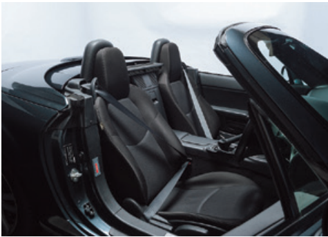
▲自動車用シートベルト

シートベルト・エアバッグについては、海外において新規車種の立ち上げ等により、売上が増加したものの、円高および国内での新車販売低迷による減産等の影響を受け、売上は減少いたしました。内装品その他についても、タイヤにおいては売上が増加したものの、その他の地域において販売が低迷し、売上は減少いたしました。