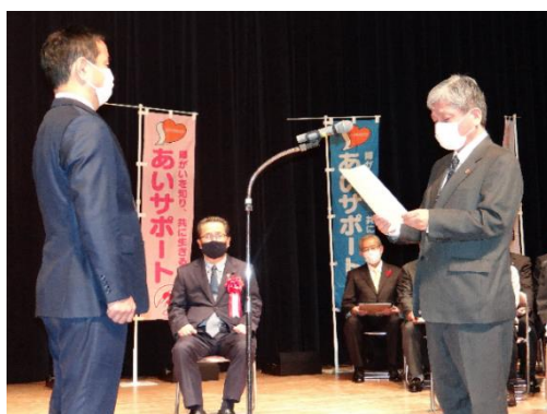
決意表明の様子(山口南総合センターにて)

今後はあいサポート企業として、「障がいを知り、共に生きる」をテーマに、より一層、従業員一人ひとりが障がい者に対する配慮を理解し、手助けの輪を広げていけるように取り組んでまいります。