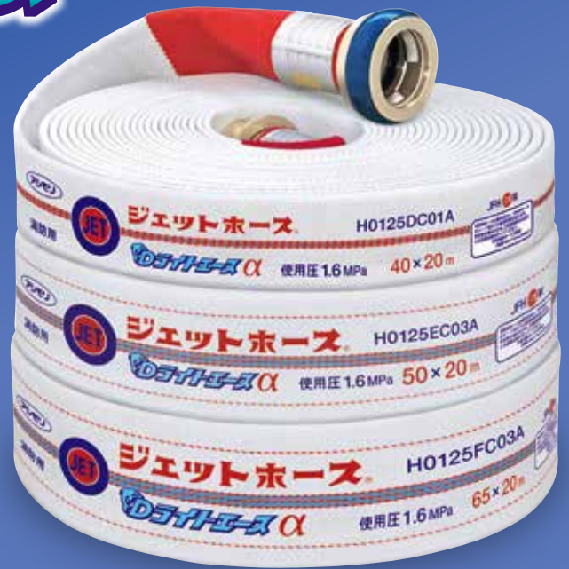
■65×20m 使用圧1.6MPaの圧力損失と流量の比較 (当社測定値)

同送水距離でポンプ圧力を低く設定することが可能なため、ポンプ負担軽減や使用燃料低減に繋がります。環境負荷の低減に貢献します。