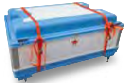
収納時外観 3段までの積み重ねが可能