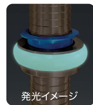
蓄光タイヤ付(オプション)