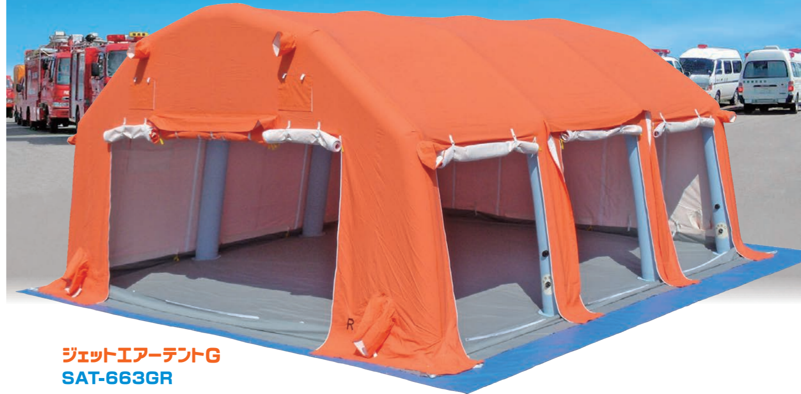
ジェットエアテントG SAT-663GR