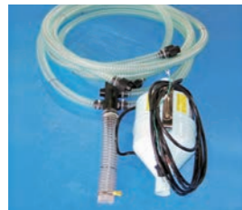
ハンディプロア (分岐ホース付)