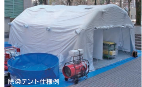
除染テント仕様例

※天幕はオレンジ色が標準色です。ご希望によりイエロー・ホワイト等も製作いたします。