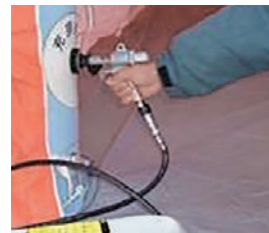
減圧器付エアガン