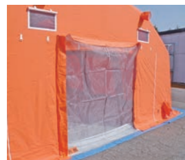
防虫ネット (2枚/セット)