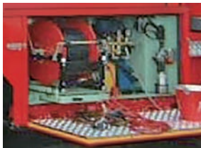
油圧PTO式 50m手動リール積載 救助工作車