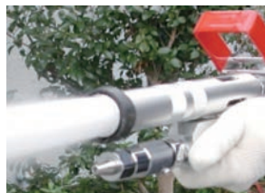
消火薬剤混合発砲放射 射程 6~10m