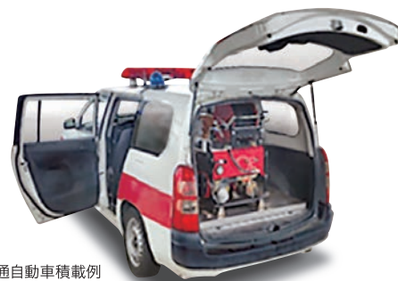
普通自動車積載例