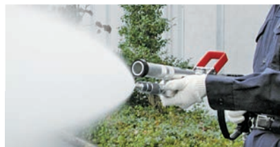
広角 30°射程 8~12m 60°射程 3~5m