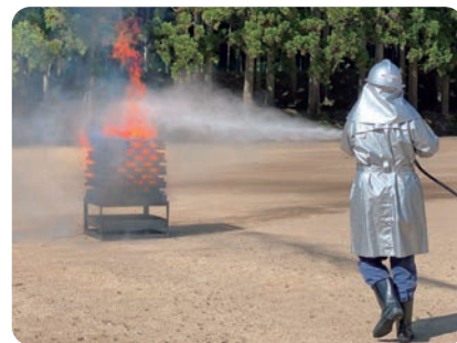
クリブへの直状での水噴霧

※このカタログの内容は2022年4月現在のものです。品質向上のため、予告なしに仕様を変更する場合がありますので、あらかじめご了承ください。