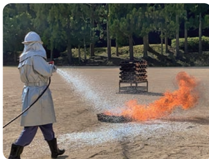
消火薬剤混合発砲放射での油消火