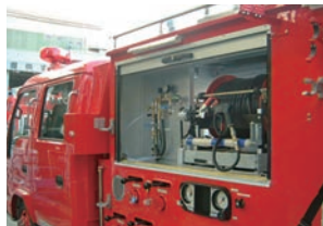
油圧PTO式手動リール積載