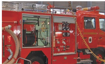
車両PTO式 100m電動リール積載