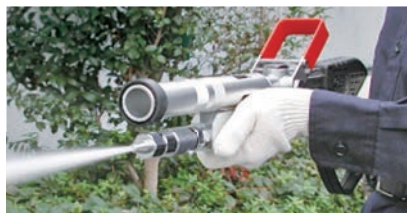
直状 射程 15~20m