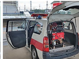
サーキット場の車両に積載されたエンジン式