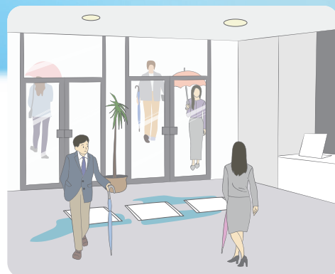
オフィスビル入口やショッピング施設、公共施設等に…