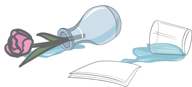
花瓶やコップの転倒に…