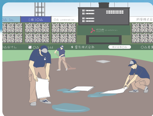
屋外スポーツ施設やイベント会場での水たまりに…