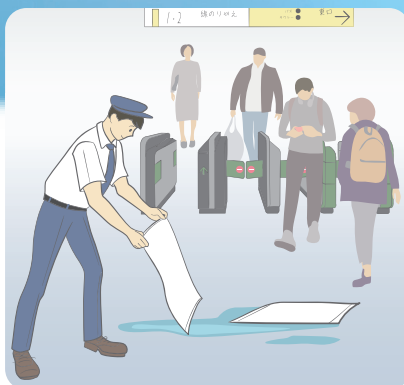
駅構内等交通施設に…